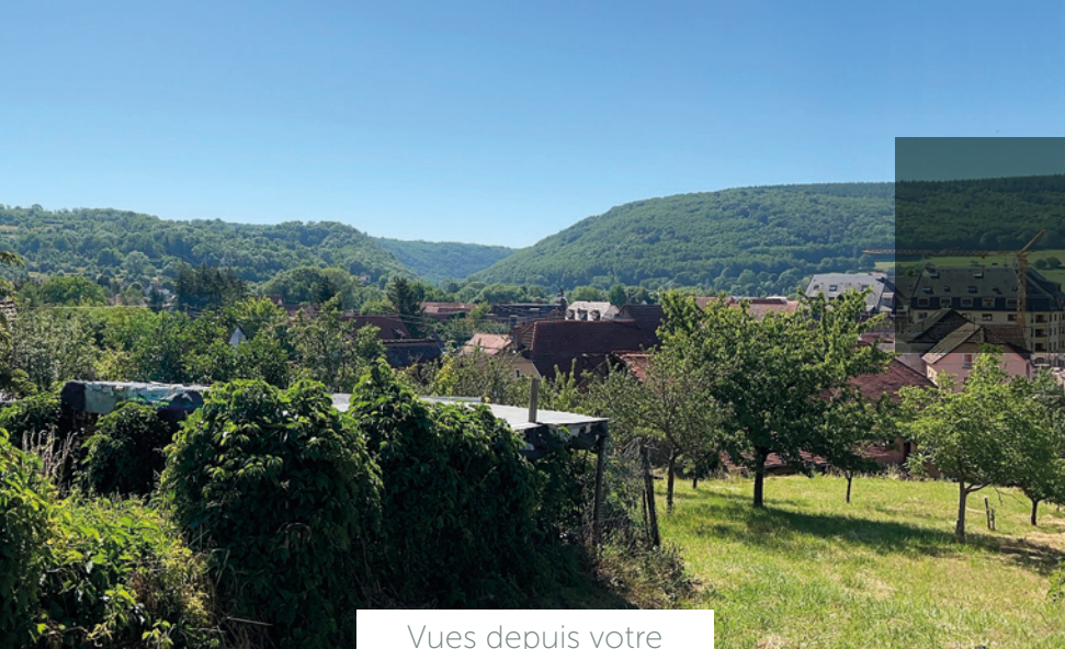
Vues depuis votre future résidence